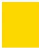
PMS Pantone Yellow